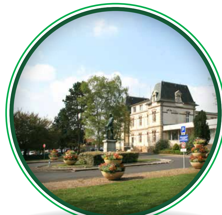
Site de Marines

Direction de la Communication GHV – Conception : Direct Graphic – Février 2022 - D7997