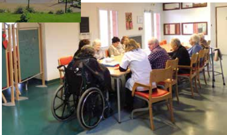
Salle du PASA