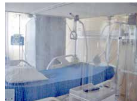
Lit à flux laminaire

Votre hospitalisation se fera en secteur protégé dans la partie soins intensifs. Ce secteur se compose de 6 lits dont 4 sont équipés d'un système de filtrage de l'air absolu, lits à flux laminaire ( Immunair ), et 2 sont équipés d'un système de haut renouvellement d'air ( Plasmair ).