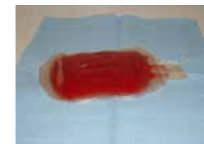
Une poche de cellules souches

Ces cellules ont pour rôle d'écourter la période d'aplasie.