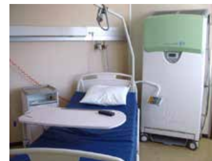
Lit avec Plasmair

L'objectif d'une hospitalisation en secteur de soins intensifs est nécessaire pour limiter le risque de complications infectieuses.